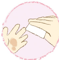
手指の汚れ落としに